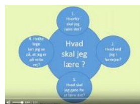
Video med vejledning til første kontaktlærersamtale - KLIK HER .

Hvor høj er din motivation for at gennemføre denne uddannelse (sæt kryds)